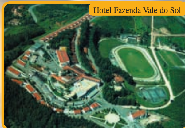
Hotel Fazenda Vale do Sol